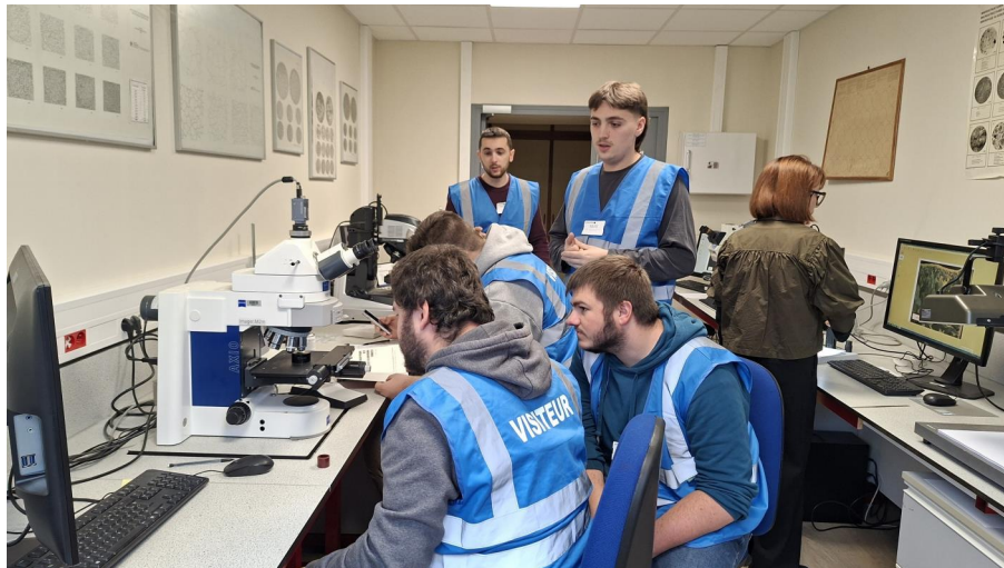
7 - Nos apprentis au CETIM de Senlis pour les TP de métallographie.

L'école remercie le CETIM et le lycée Marie Curie de Nogent sur Oise pour l'organisation de ces TP.